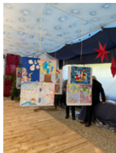
Esame dei disegni distrettuali