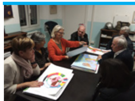
L'esame dei disegni del Comprensivo di Rapallo nella nostra sede