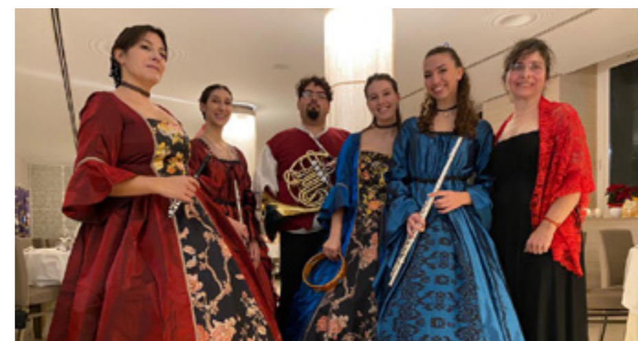
Nelle foto: il tavolo presidenziale con accanto i rappresentanti dei club ospiti; il quintetto dei Gilda Musicorum