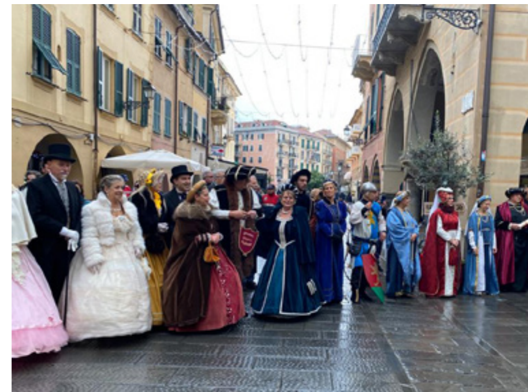
La manifestazione del Confuoco nella quale è stato consegnato dal nostro Club l'11° Premio Turpini