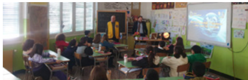
Il rappresentante del nostro Club Tanfani all'incontro con i ragazzi del San Benedetto